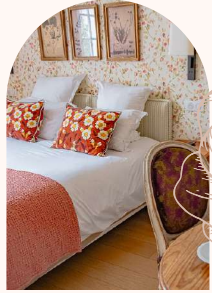
39 chambres et suites dont 24 chambres twins