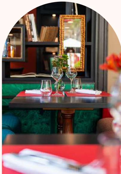
La Table du Saint Christophe Le salon privatif Flaubert Grande terrasse ombragée