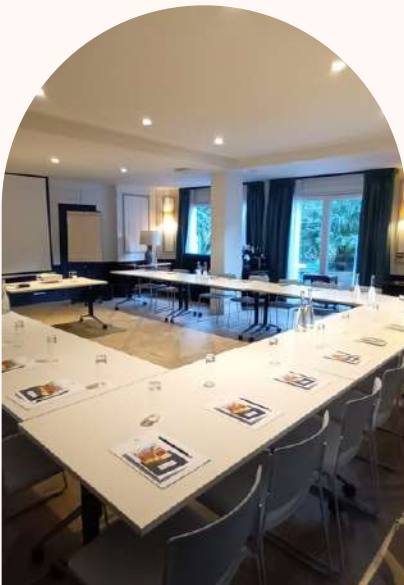
3 salles de réunion à la lumière du jour jusqu'à 40 personnes

En plein cœur de La Baule, à 100m de la plage, découvrez un lieu authentique pour réunir vos équipes. Nichées dans l'un des quartiers historiques de la station balnéaire, le Saint Christophe se compose de 4 petites villas des années 1900 unies par un jardin verdoyant et fleuri ... Un lieu hors du temps.